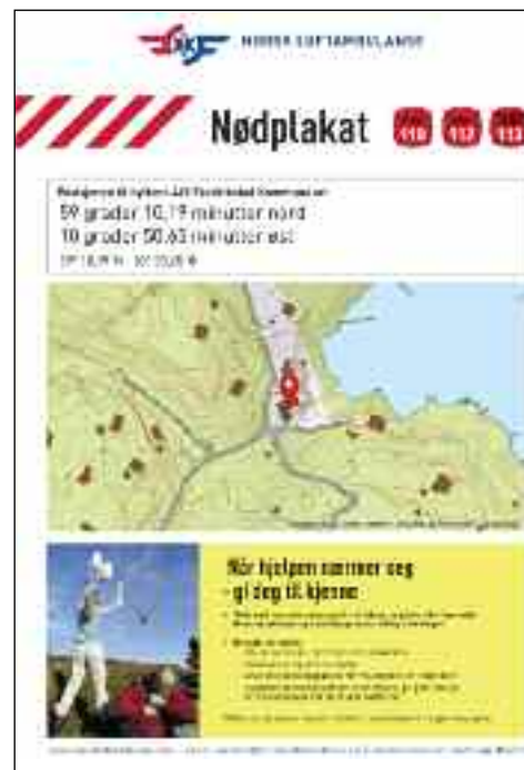
Her er et eksempel på nødplakat.

I tillegg til å henge en nødplakat på innsiden av hytta, kan det være en idé å henge en utskrift også på utsiden, slik at forbipasserende kan bruke plakaten til å skaffe hjelp.