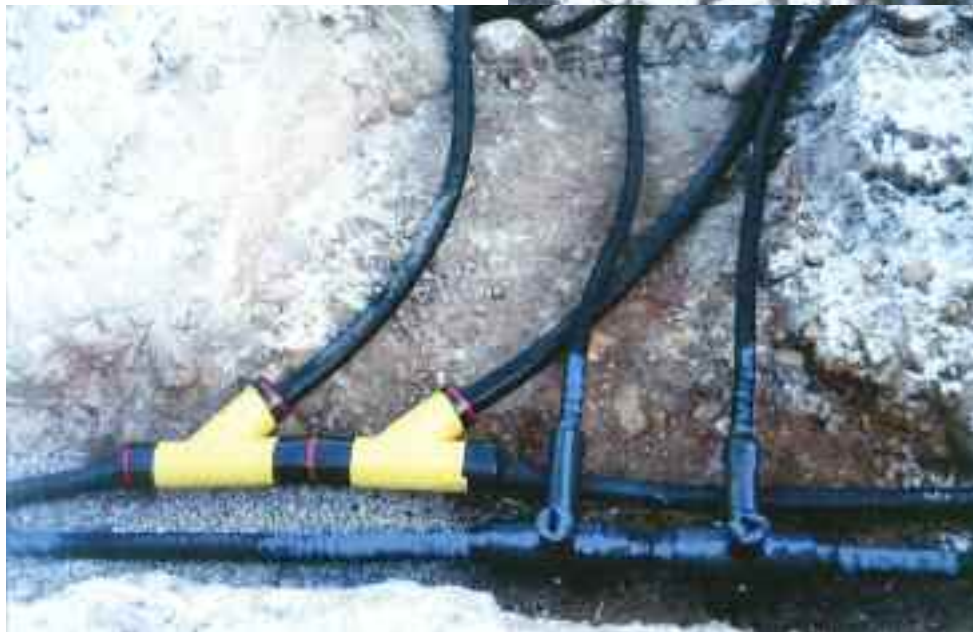
Stikkledninger for pumpeledning og vannledning.