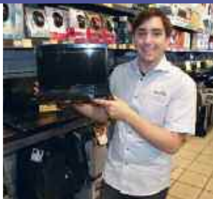
Dag i data/teleavd. yter topp service!