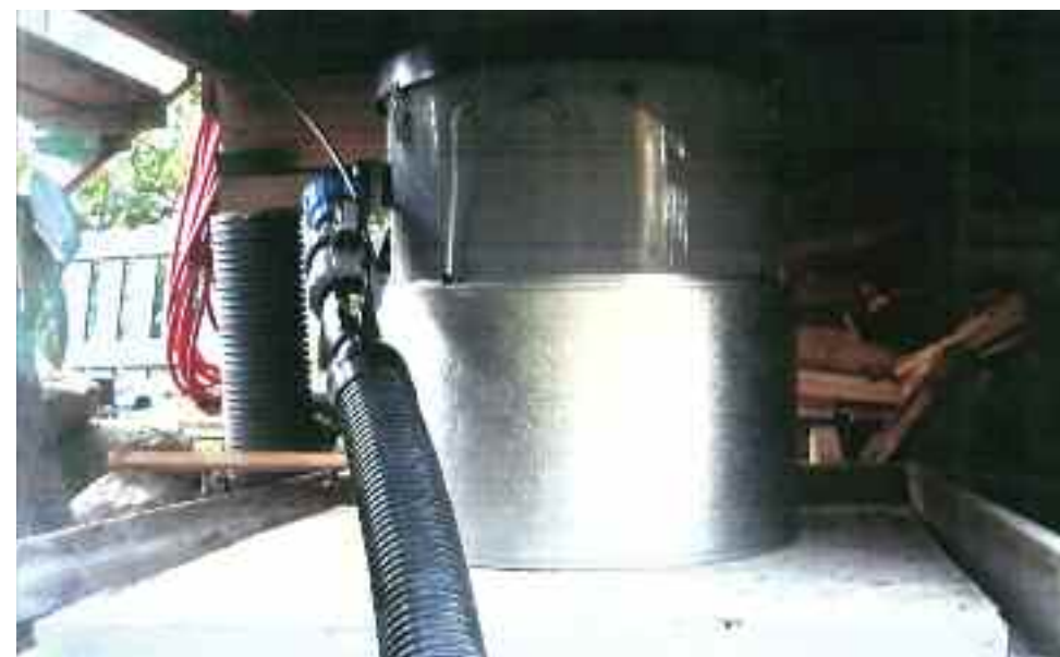
Isolert pumpestasjon plassert under veranda.