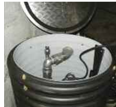
Pumpestasjon plassert i kjeller.

Granholmen Vann og Avløpsanlegg SA – Kjetil Roppestad. Har 37 hytter tilknyttet